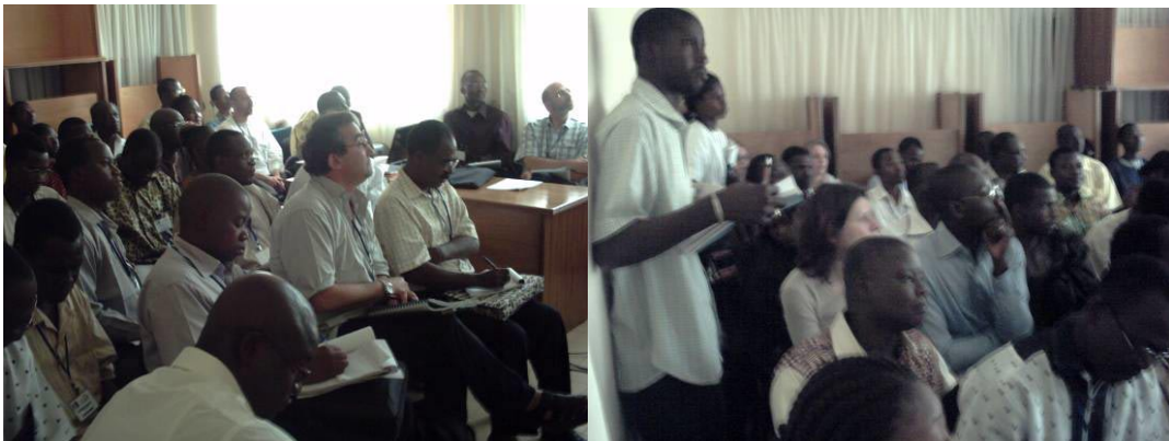
Salle 2 des communications : salle de réunion

Les sessions ont toujours commencé à l'heure. L'offre du déjeuner sur place a permis la reprise des sessions de l'après midi à l'heure et en présence de nombreuses personnes.