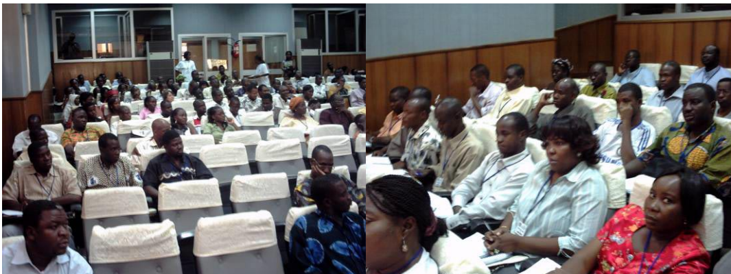
Salle 1 des communications orales : salle de conférence